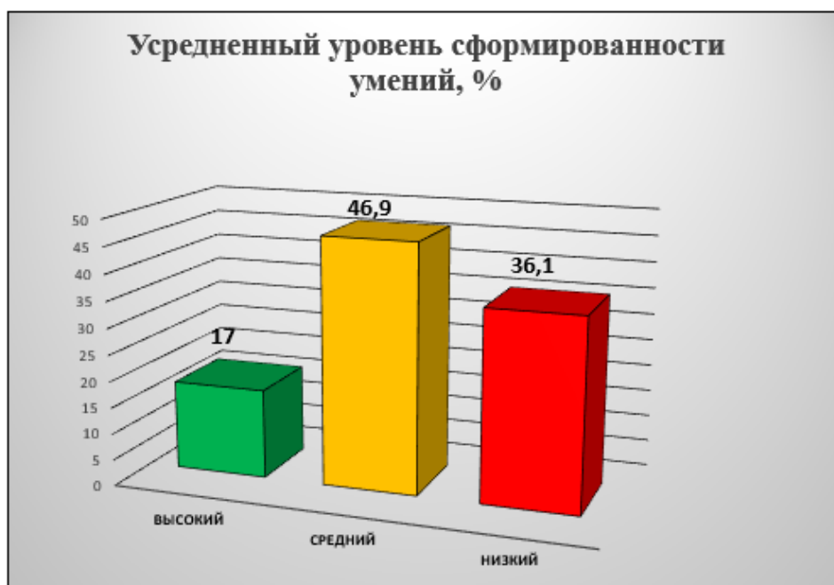
Рисунок 2.7. – Усредненные показатели исходного уровня умений анализа и обработки информации, необходимых для приобретения опыта исследовательской деятельности на уроках химии в 10-х классах

Правильно оформленные графики и диаграммы имеют предельно краткие надписи (лучше буквенные обозначения) для каждой из осей. Отдельные кривые нумеруются курсивными арабскими цифрами.